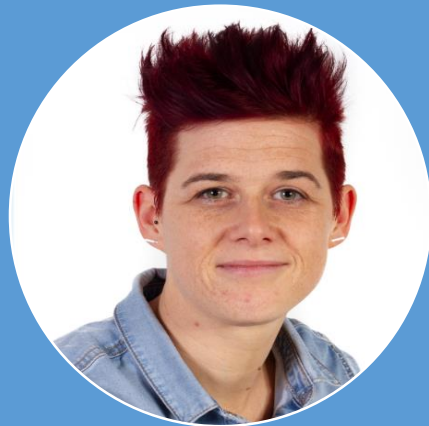
Financieel en operationeel directeur