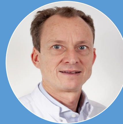
Hoofdarts – medisch directeur

Ombudsdienst Preventie & milieuzorg Informatieveiligheid & gegevensbescherming Apotheek PR HR Kwaliteit & patiëntveiligheid Directiesecretariaat EPD en procesoptimalisatie